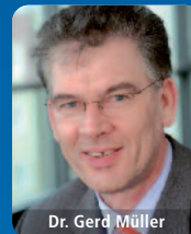
Dr. Gerd Müller